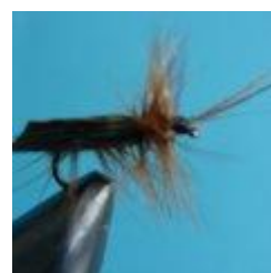
Sedge trocken Hakengröße 14 - 18