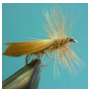
Sedge trocken hellbraun Hakengröße 12 – 16