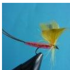
Maifliege trocken, Far- ben gelb und orange Hakengröße 10 – 14