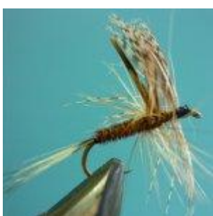
Märzbraune Trocken Hakengröße 12 – 16