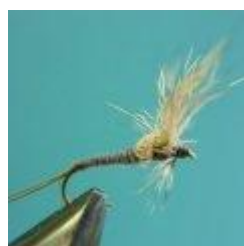
Köcherfliege trocken Hakengröße 14 – 18