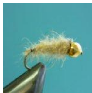
Goldkopfnympe in den Farben braun und beige Hakengröße 14 - 16