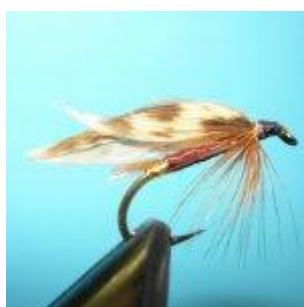
Märzbraune Nass Hakengröße 10 – 14