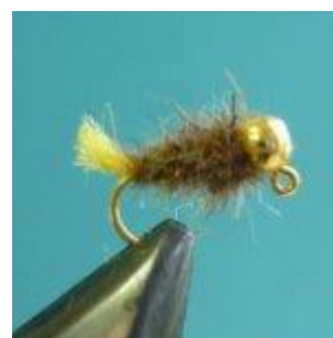
Goldkopfnympe , Farbe braun, beige oder grau für Äschen Hakengröße 16 – 20