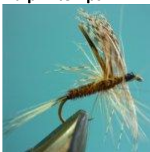
March Brown dry Hook size 12 - 16