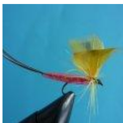
Mayfly dry, color yellow and orange, Hook size 10 - 14